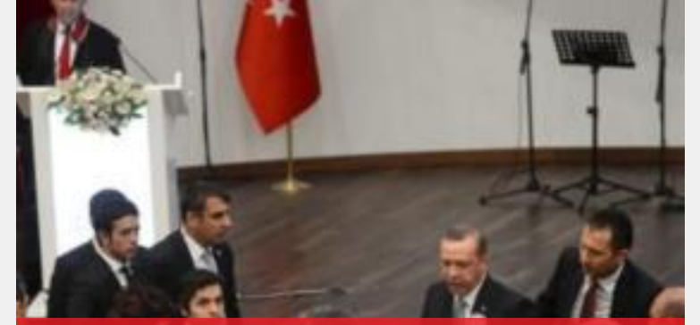
Metin Feyzioğlu'ndan Erdoğan'ın restine rest!