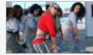
Jennifer Lopez'in yeni albümü AKA'nın teaser'ı rekor kırdı