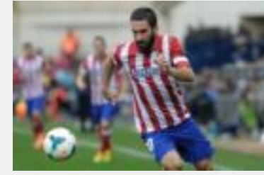
Arda Turan Beşiktaş forması giyecek