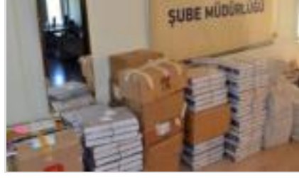
Milli Eğitim'den korsan kitap