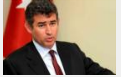
Feyzioğlu: Buralara halk layık görür