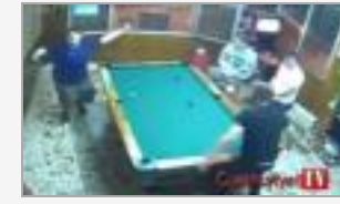
Yok böyle şans!