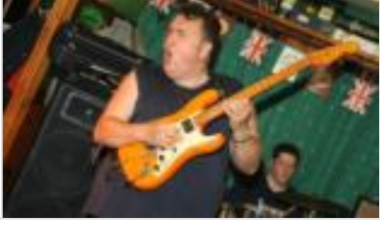
Ünlü gitarist kalp krizi geçirdi