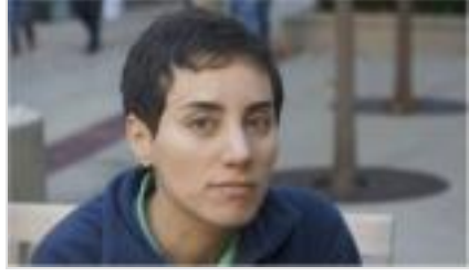
İranlı bilim kadını matematiğin Nobel'ini